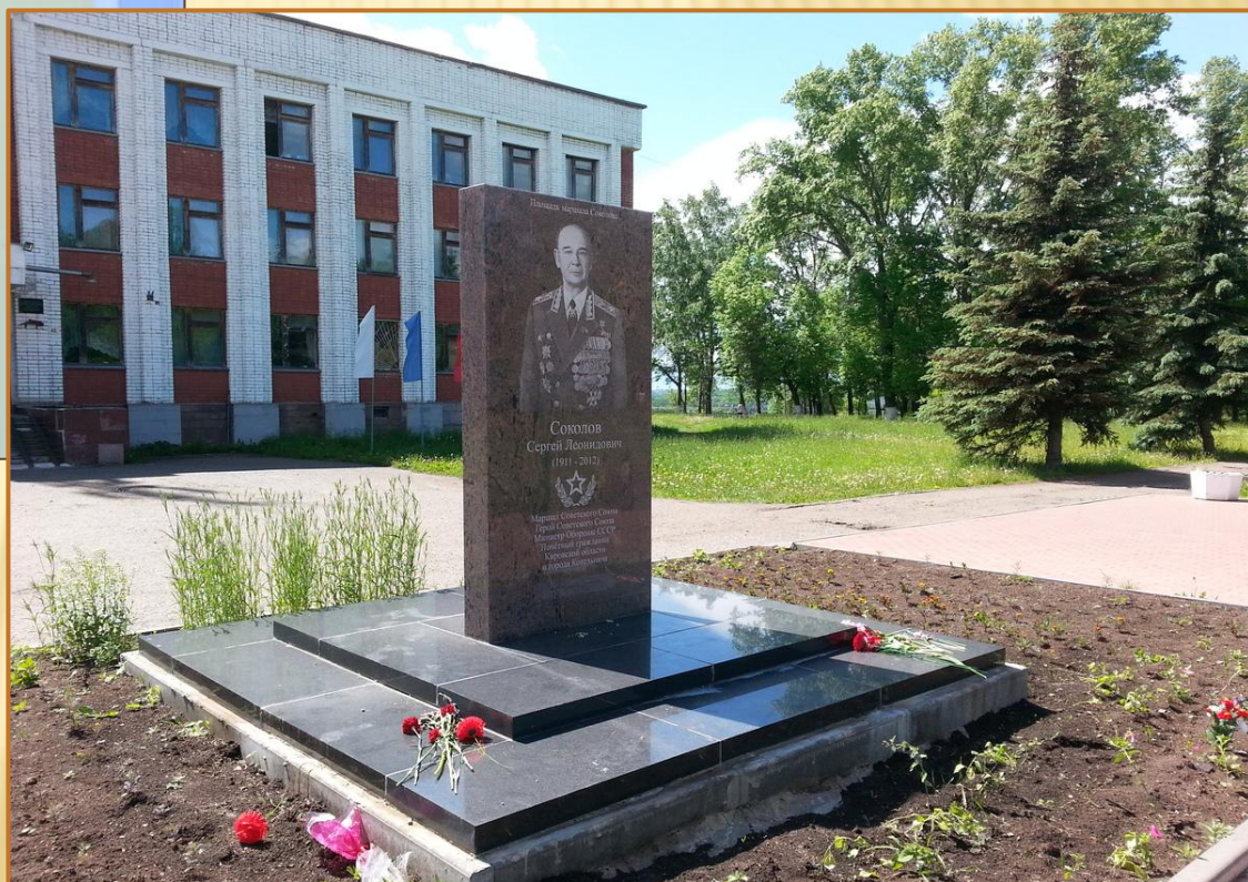
Площадь имени Маршала С.Л. Соколова