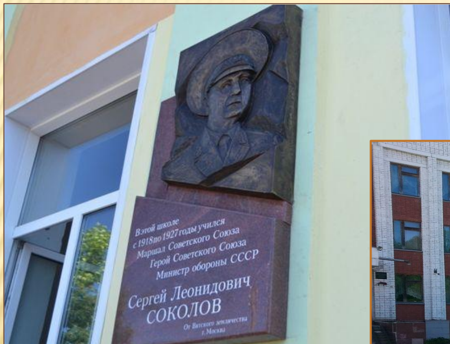
Бюст на здании школы