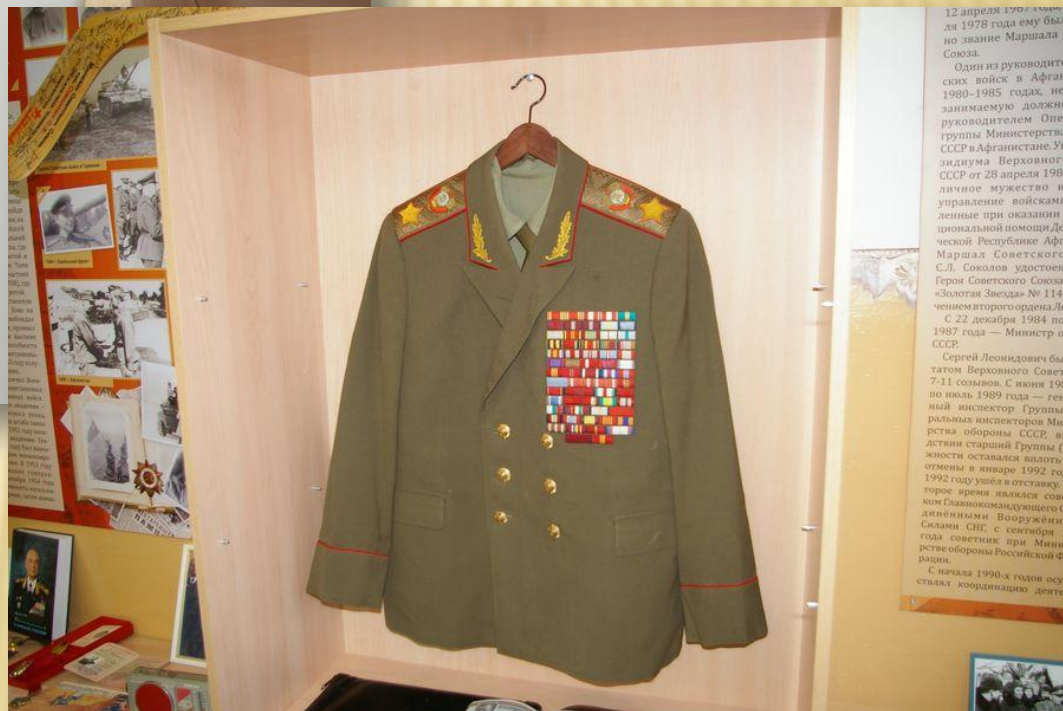
Мундир С.Л. Соколова

12 апреля 1978 года ему было присвоено звание Маршала Советского Союза. Один из руководителей войск в Афганистане в 1980-1985 годах, не занимаемому должностям руководителем Оперативной группы Министерства обороны СССР в Афганистане. Указом Президиума Верховного Совета СССР от 28 апреля 1980 года удостоен звания Героя Советского Союза (Золотая Звезда) № 11438 за мужество и героизм при выполнении заданий в Афганистане, проявленные при оказании международной помощи Демократической Республике Афганистан. С.Л. Соколов удостоен звания Героя Советского Союза (Золотая Звезда) № 11438 за мужество и героизм при выполнении заданий в Афганистане, проявленные при оказании международной помощи Демократической Республике Афганистан. С.Л. Соколов был заместителем командира Группы (и в дальнейшем командиром) в Афганистане. В 1982 году ушел в отставку. В 1992 году ушел в отставку. В 1992 году ушел в отставку. В 1992 году ушел в отставку. С.Л. Соколов был заместителем командира Группы (и в дальнейшем командиром) в Афганистане. В 1982 году ушел в отставку. В 1992 году ушел в отставку. В 1992 году ушел в отставку.